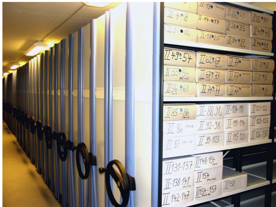
Magazin zur sicheren Aufbewahrung der Archivalien im neuen Stadtarchiv an der Kellerstraße