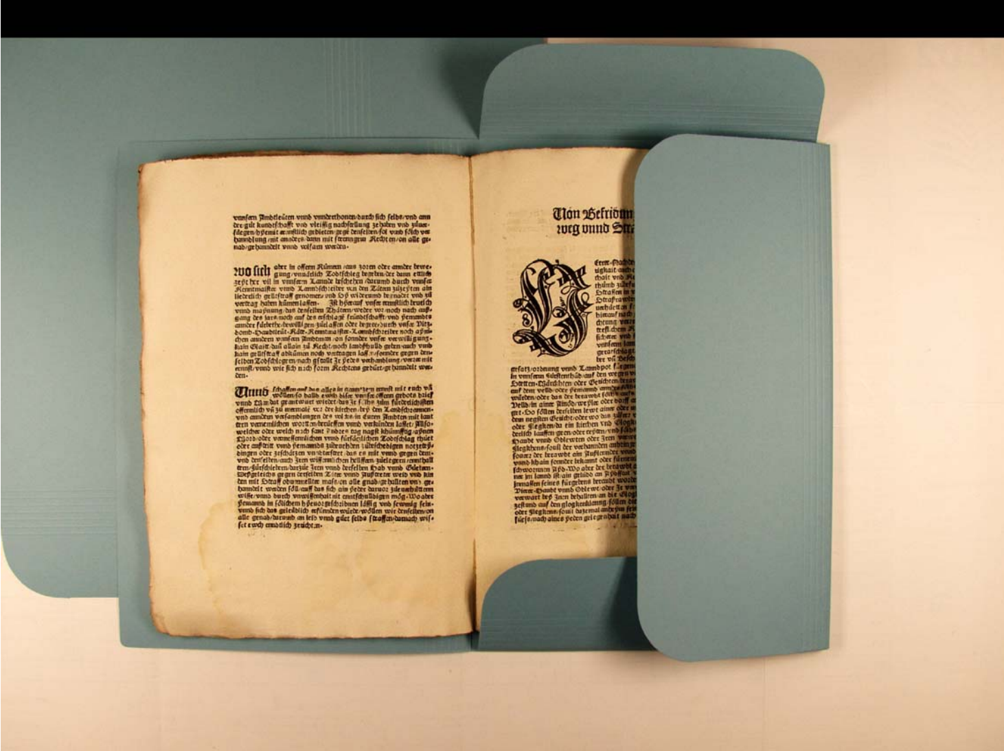
Konservierung der bedeutenden Archivalien

Ziele des Stadtarchivs: Die Archivalien sind nicht erschlossen. Dies geschieht nach der Unterbringung der Bestände im neuen Stadtarchiv. Konservatorisch werden die Archivalien neben einer sachgerechten Unterbringung in den klimatisierten Magazinen in alterungsbeständige Archivkartons und Mappen verpackt (siehe Bild rechts).