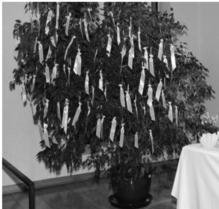
Bildunterschrift: Die Erinnerungsbänder können auch jetzt noch in der Klinikkapelle abgeholt werden