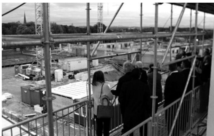
Der Wasserburger Unternehmerstammtisch besichtigte die Großbaustelle von kbo-Inn-Salzach-Klinikum und RoMed Klinik Wasserburg